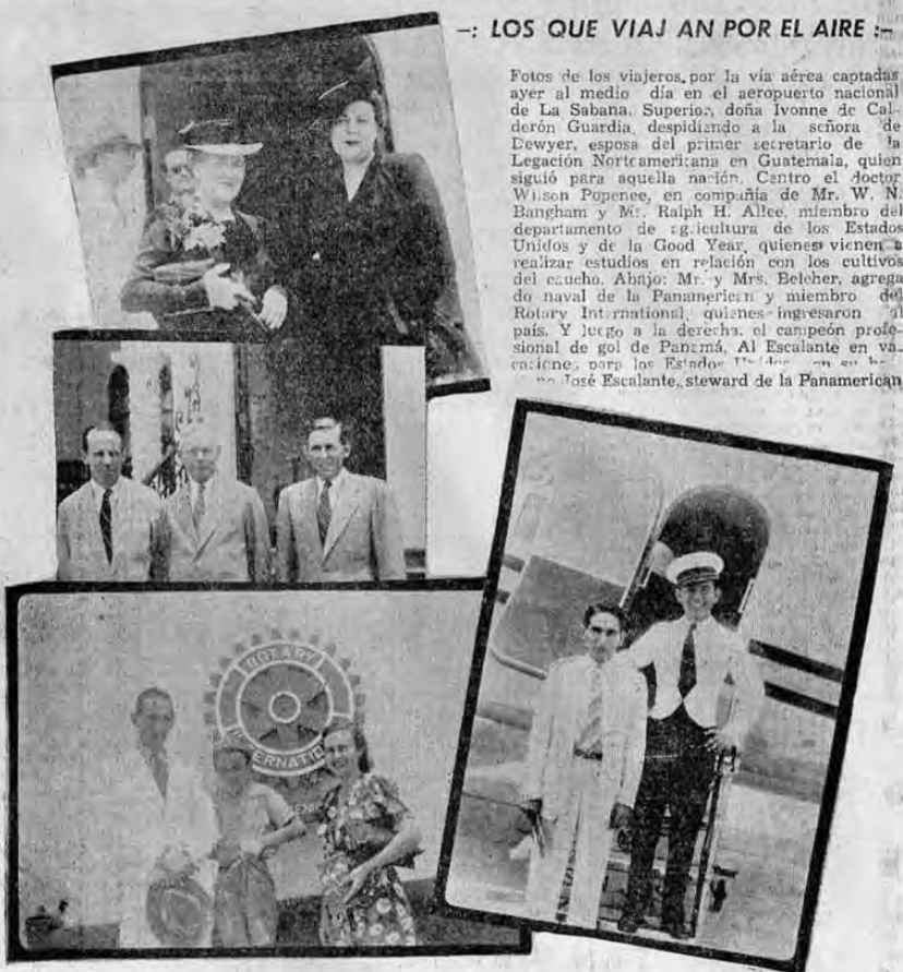
LOS QUE VIAJAN POR EL AIRE

POSTERGADA LA CONSIDERACION DEL AUMENTO DE CUOTAS WASHINGTON, 17 UP. — La junta del café ha postergado la acción sobre cuotas de café hasta el 30 de los corrientes o sea, hasta el día antes de iniciarse el nuevo año cafetero.