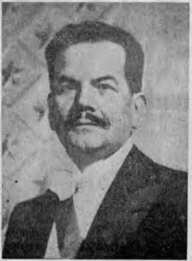
Excmo. Sr. don PEDRO AGUIRRE CERDA, Presidente de Chile.