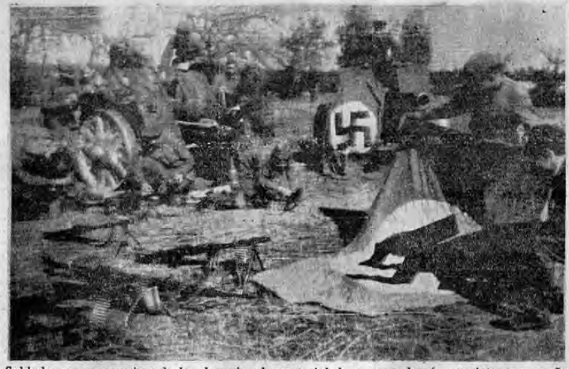
Soldados rusos examinando los despojos de material de guerra alemán consistente en cañones, banderas, ametralladoras y armas automáticas que los regimientos nazis dejaron en el campo después de haber sufrido el rechazo de su asalto contra las posiciones rusas en un lugar que no se nombra del frente oriental. La foto fué radiada desde Moscú a Londres.

— DESPUES DE SER RECHAZADO UN ASALTO ALEMAN —