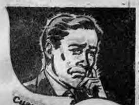
Cuando la Placa es Amenaza

LONDRES, 17. UP. — Un comentarista militar al comentar la situación militar por radiotelefono dijo, según los círculos locales "que es de esperar que se produzca en una fecha próxima una ofensiva en gran escala en Libia por las fuerzas inglesas". Afirmó que los británicos tratan de emprender una acción que alivie la situación de los soviéticos.